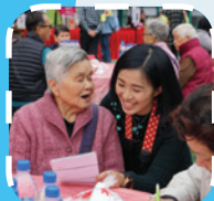
5. 對「里」太在乎，精彩花絮