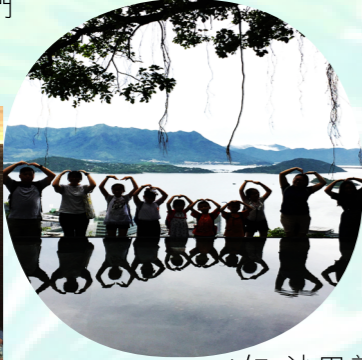
4/7 沙田新城市廣場 香港中文大學