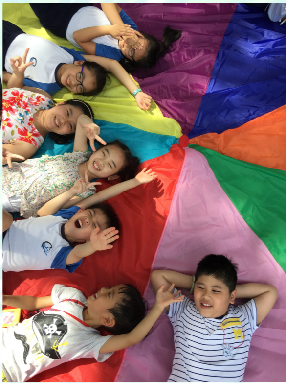
14/7 鯉魚門 + 三家村