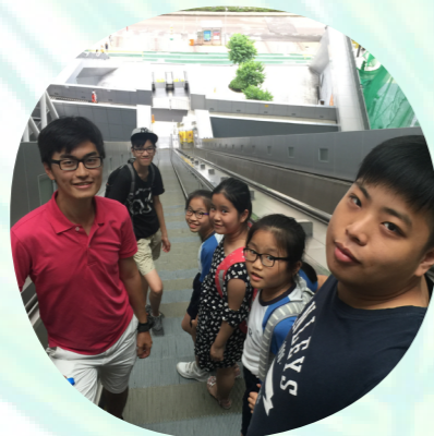
6/7 香港知專設計學院

活動由青少年大哥哥大姐姐作嚮導，帶領小朋友游走香港不同地方。小朋友單純率真，有得玩有得食就已經很滿足，他們精力充沛不會有成年人的疲憊，加上暑假不用上學，他們玩得更投入更開心。